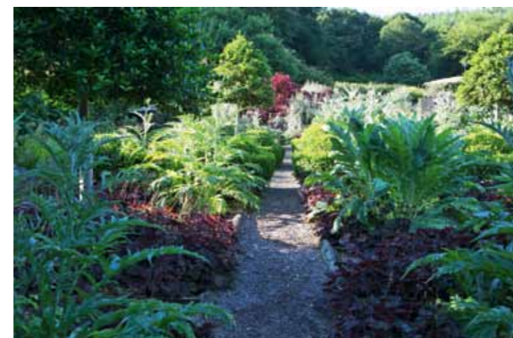
De kleurencombinatie in Charles' Garden is donkerrood met grijsgroen. Bladplanten spelen hier de hoofdrol, zoals Cynara cardunculus , Heuchera , Buxus , Cotinus en diverse siergrassen. De beplanting is ontworpen door Charles Hawes.