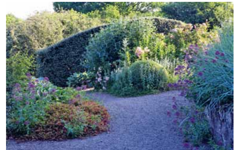
Op een zonnige plek een zachtroze met grijsgroen kleurenschema met Centranthus , Buddleja , Hosta , witbonte Buxus en rozen. De haag is van Cotoneaster franchetii , een half wintergroene dwergmispel tot 2 m hoog.