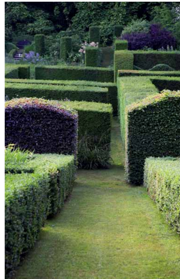
Brede graspaden lopen vanaf het hoogste punt de tuin in, hier loop je door de grassenparterre richting de 'Pool-garden' tussen hoge en lage hagen. De tuinvandeling is een ontdekkingsreis: achter elke haag wacht een verrassing, elke tuinkamer is anders ingericht.

Het knippen van de hagen is wel een behoorlijke klus, dit wordt in etappes uitgevoerd. De hoge hagen zijn van Taxus baccata , ze zijn recht van vorm. De haag van Fagus sylvatica is als contrast aan de bovenzijde in een golvende vorm gesnoeid, een thema dat overal terugkomt in de tuin. Aan de ene kant bestaat de haag uit groene beuk, aan de andere kant uit rode beuk. Dit zorgt voor een bijzonder tweekleurig effect. Langs de beukenhaag is een smalle strook waar Carex pendula zich mag uitbreiden. De rechte lijn van de haag wordt zo gebroken. Lage hagen van Buxus sempervirens zijn gebruikt voor de indeling binnen de tuinkamers en de grassenparterre. <