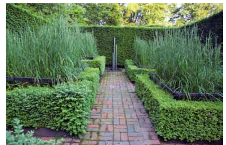
Een van de tuinkamers heeft een strakke indeling gekregen met lage Buxus -hagen en Calamagrostis x acutiflora 'Karl Foerster'. De grassen zijn ingekaderd door een frame van zwartgeschilderde planken, met daarop de namen van akkerkruiden. Aan het eind een waterelement van rvs.